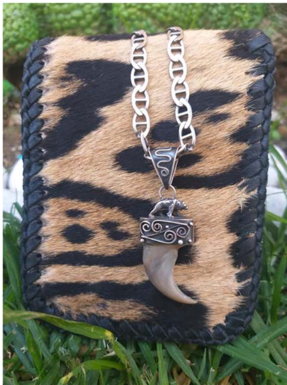
Imagen 2. Cartera confeccionada con piel de jaguar y una garra de oso