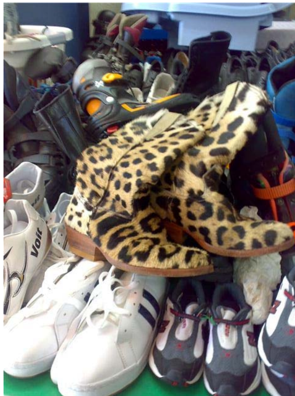
Imagen 3. Venta de botas confeccionadas con piel de jaguar en el estado de Hidalgo, México (2008). Este producto no tenía marca lo que delimita su fabricación de origen popular, artesanal

La utilización de jaguares vivos o el uso de sus partes en la industria de la moda representa la máxima transformación del jaguar en mercancía objeto-cosa-propiedad, alejando y encubriendo dimensiones ontológicas de su ser y esencia. Como se ha señalado, el jaguar y su piel tuvieron un fuerte impacto en la industria de la moda que arrebató y redujo a este animal y sus partes en propiedad, clasando de buen y distinguido gusto el uso de sus partes (principalmente piel, dentición, huesos, grasa, órganos, sangre y garras) y su esclavitud como mascota. Al mismo tiempo de clasante de quienes usaban estos materiales y consagrando una jerarquía social. Esto generó todo un complejo sistema económico de oferta y demanda del producto, formulándose el gusto asociado a la cosificación, aniquilación, esclavitud y mercantilización del jaguar. Se trata del conjunto de prácticas y propiedades de una persona o de un grupo, son el producto de un encuentro (de una armonía preestablecida) entre bienes y un gusto 121 . El dinamismo de la industria de la moda propició el desplazamiento del polo dominante al polo dominado en la confección de la piel del jaguar que tuvo una producción importante en la peletería, donde se reprodujeron objetos de moda de jaguar de origen popular (Imagen 3) e incluso el desplazamiento, aunque también se ha instrumentado en la cosificación del jaguar como mascota, principalmente de grupos pertenecientes al crimen organizado.