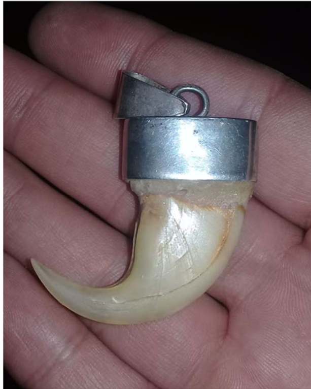
Imagen 1. Garra de jaguar confeccionada en plata como supuesto amuleto